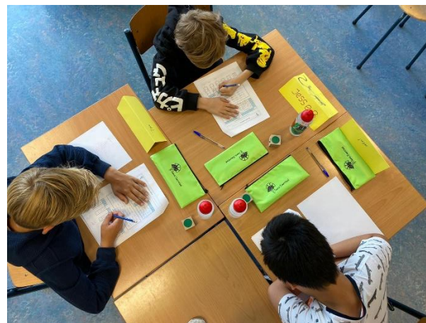
Aan het werk

Er is afgelopen week ontzettend al veel moois gemaakt, ontworpen, geproefd, gebouwd, geëxperimenteerd, geknutseld en uitgedacht. Veel workshops zijn door de leerkrachten zelf begeleidt, maar ook waren er workshops van Fluxus en het optreden MadScience was super leuk en leerzaam.