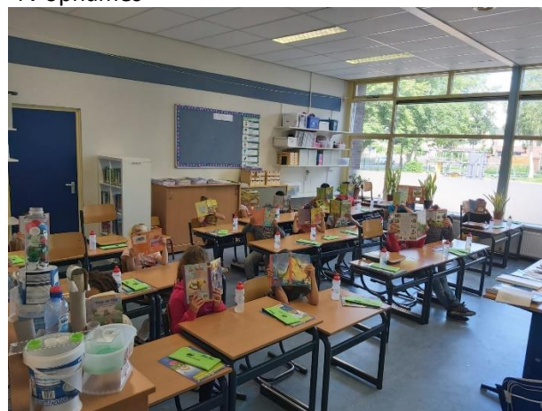
Lezen met de bieb